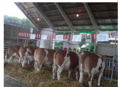
Die österreichische Zuchtrinderkollektion in Gornja Radgona