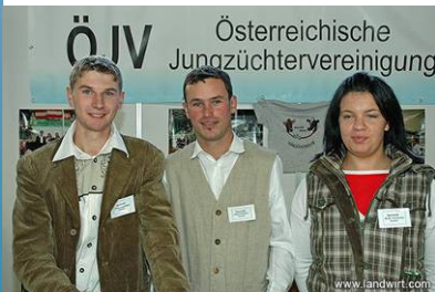
Die österreichische Jungzüchtervereinigung (ÖJV) sorgte für die sehr kreative Umrahmung der Bundesrinderschau 2006.