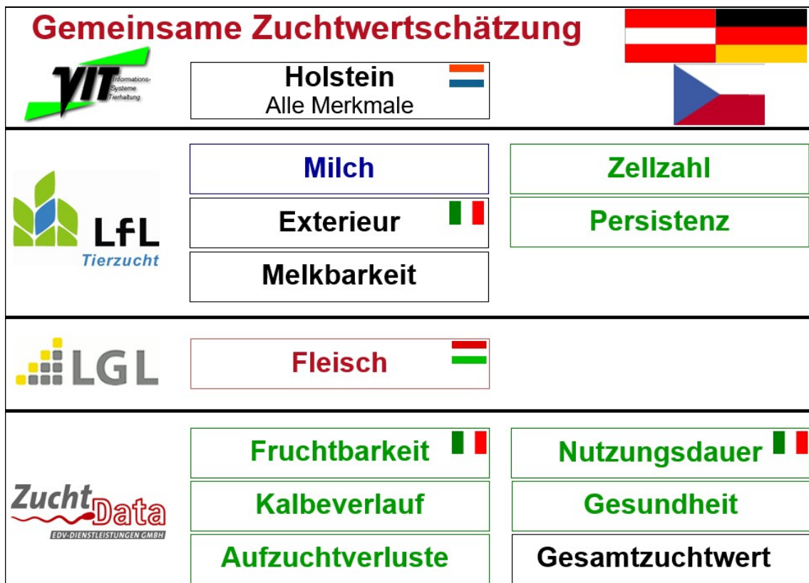
Abbildung 1: Aufteilung der gemeinsamen Zuchtwertschätzung auf die Rechenzentren.

Deutschland und Österreich haben sich zu dieser fachlich optimalen Variante für alle Rassen entschlossen. Mit der Zuchtwertschätzung für die Exterieurmerkmale beim Fleckvieh ist bereits im Jahr 2000 der Startschuss für eine gemeinsame Zuchtwertschätzung Österreich-Deutschland erfolgt. Die Erfahrungen bei diesen Merkmalen waren sehr positiv, sodass im Jahr 2002 alle weiteren Merkmale gefolgt sind. Somit wird jetzt für alle Merkmale und alle Rassen die Zuchtwertschätzung gemeinsam durchgeführt. Mittlerweile ist Fleckvieh-Tschechien bei allen Merkmalen außer Gesundheit dabei, Ungarn beteiligt sich an der Fleisch-ZWS beim Fleckvieh und Italien bei Exterieur, Nutzungsdauer und Fruchtbarkeit.