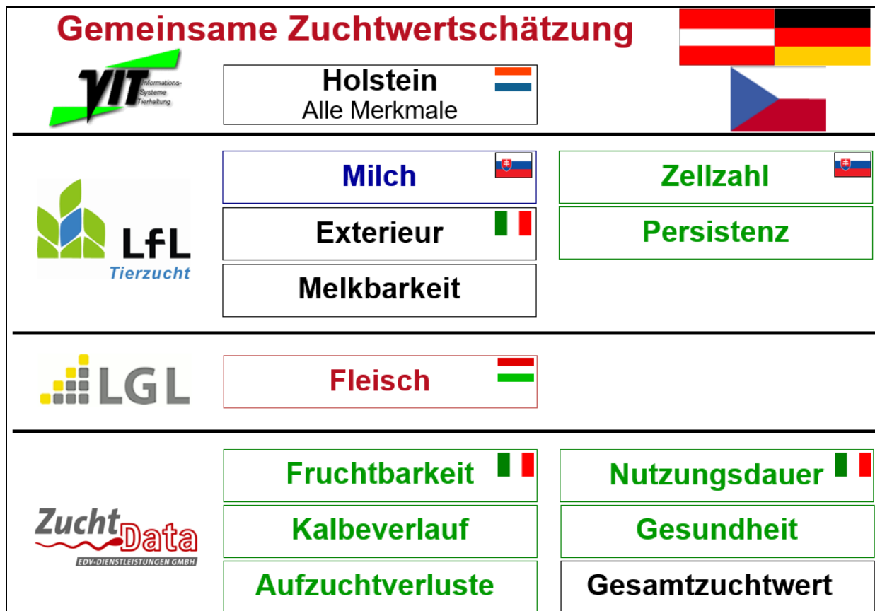
Abbildung 1: Aufteilung der gemeinsamen Zuchtwertschätzung auf die Rechenzentren.

Deutschland und Österreich haben sich zu dieser fachlich optimalen Variante für alle Rassen entschlossen. Mit der Zuchtwertschätzung für die Exterieurmerkmale beim Fleckvieh ist bereits im Jahr 2000 der Startschuss für eine gemeinsame Zuchtwertschätzung Österreich-Deutschland erfolgt. Die Erfahrungen bei diesen Merkmalen waren sehr positiv, sodass im Jahr 2002 alle weiteren Merkmale gefolgt sind. Somit wird jetzt für alle Merkmale und alle Rassen die Zuchtwertschätzung gemeinsam durchgeführt. Mittlerweile ist Fleckvieh-Tschechien bei allen Merkmalen außer Gesundheit dabei, Ungarn beteiligt sich an der Fleisch-ZWS beim Fleckvieh, Italien bei Exterieur, Nutzungsdauer und Fruchtbarkeit und die Slowakei bei Milch und Zellzahl.