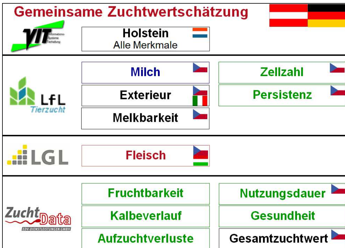
Abbildung 1: Aufteilung der gemeinsamen Zuchtwertschätzung auf die Rechenzentren.

Deutschland und Österreich haben sich zu dieser fachlich optimalen Variante für alle Rassen entschlossen. Mit der Zuchtwertschätzung für die Exterieurmerkmale beim Fleckvieh ist bereits im Jahr 2000 der Startschuss für eine gemeinsame Zuchtwertschätzung Österreich-Deutschland erfolgt. Seit 2002 ist beim Exterieur auch Italien mit dabei. Die Erfahrungen bei diesen Merkmalen waren sehr positiv, sodass im Jahr 2002 alle weiteren Merkmale gefolgt sind. Somit wird jetzt für alle Merkmale und alle Rassen die Zuchtwertschätzung gemeinsam durchgeführt. Mittlerweile ist Fleckvieh-Tschechien bereits bei Milch, Fleisch, Nutzungsdauer, Zellzahl, Melkbarkeit, Exterieur und beim Gesamtzuchtwert dabei, Ungarn beteiligt sich an der Fleisch-ZWS beim Fleckvieh. Tschechien wird sich in den nächsten Jahren auch an den restlichen Merkmalen beteiligen.