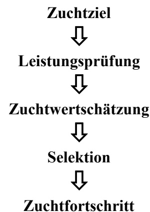
Abb. 1: Ablaufschema im Zuchtgeschehen:

Die Leistungsprüfung ist eine unabdingbare